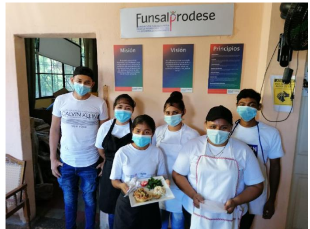
Curso de cocina