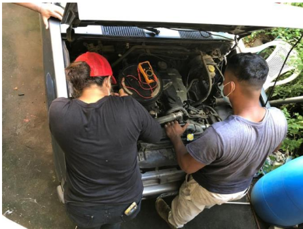
Curso de mecánica automotriz