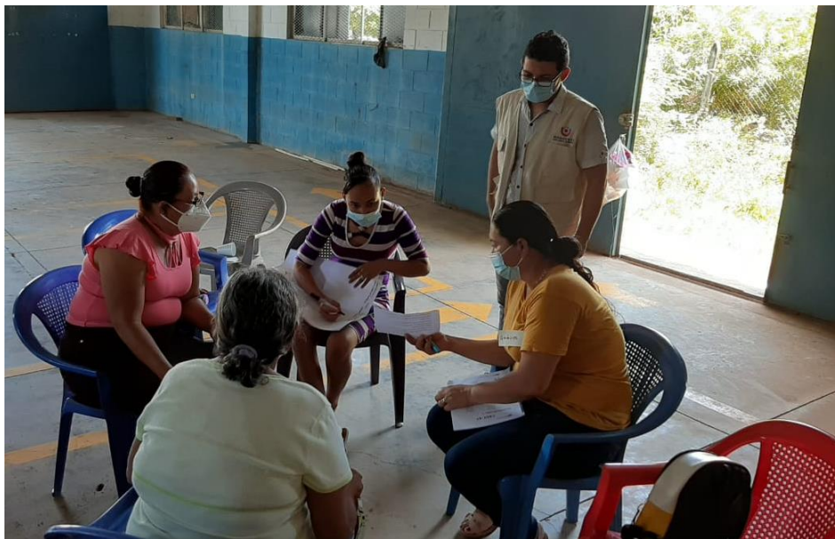
Proceso Formativo del Sistema de Protección Social Universal (SPSU) en siete municipios de Usulután.

El desarrollo del proceso formativo sobre el SPSU fue un espacio de análisis, reflexión y sensibilización con liderazgos comunitarios, en el que se abordaron diversas temáticas de interés general para la población, donde se logró identificar los beneficios de los programas sociales, así como, los avances, retrocesos y desafíos en materia de protección social en El Salvador.