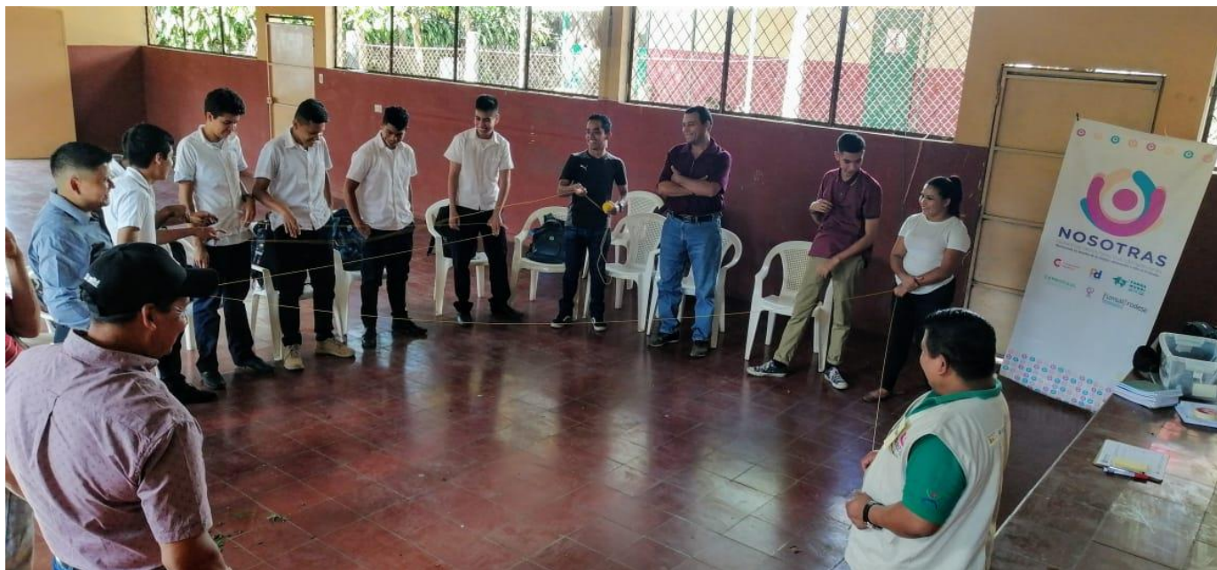
Proceso de Masculinidades en Santiago de María, Usulután

En el departamento de Usulután, en el marco del Convenio AECID, se realizaron los procesos de formación en masculinidades en los municipios de Santiago de María, Mercedes Umaña y Nueva Granada, con la finalidad promover en los hombres de las comunidades y administraciones públicas locales, las desigualdades y la violencia que viven las mujeres en diversos ámbitos, asimismo, se les sensibiliza para que se involucren de manera individual y colectiva para revertir esta situación y reducir las brechas y desigualdades por razón de género.