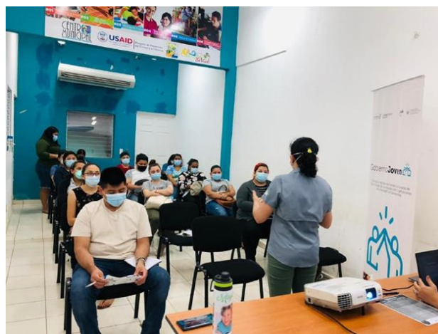
Técnica de ISDEMU impartiendo Tipos de violencia y protocolo de atención a víctimas