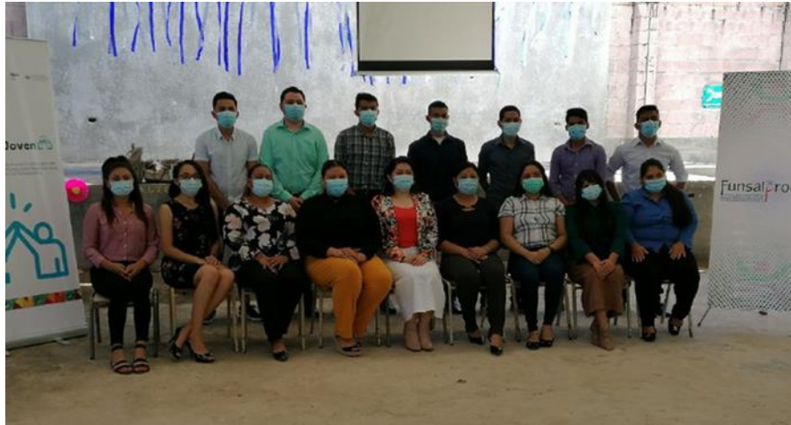
Clausura de proceso formativo de jóvenes en La Unión.