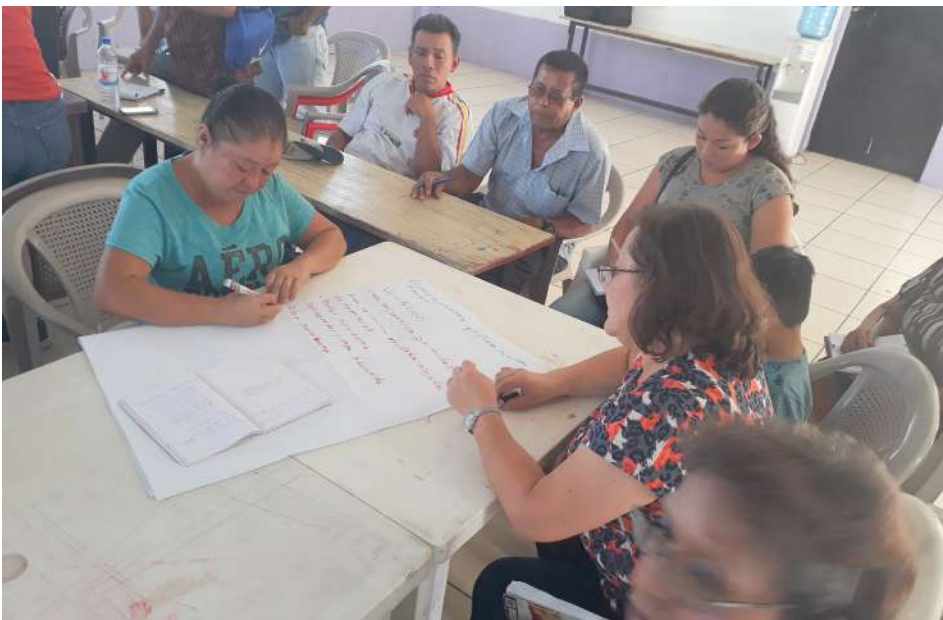
Representantes de CCPC del cantón San Ramón se capacitan en manejo de albergues temporales.