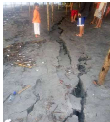
Grieta registrada en la playa La puntilla, departamento de La Paz.

El Ministerio de Defensa Nacional puso a disposición aeronaves, vehículos y personal, para apoyar a las autoridades y población de ser necesario.