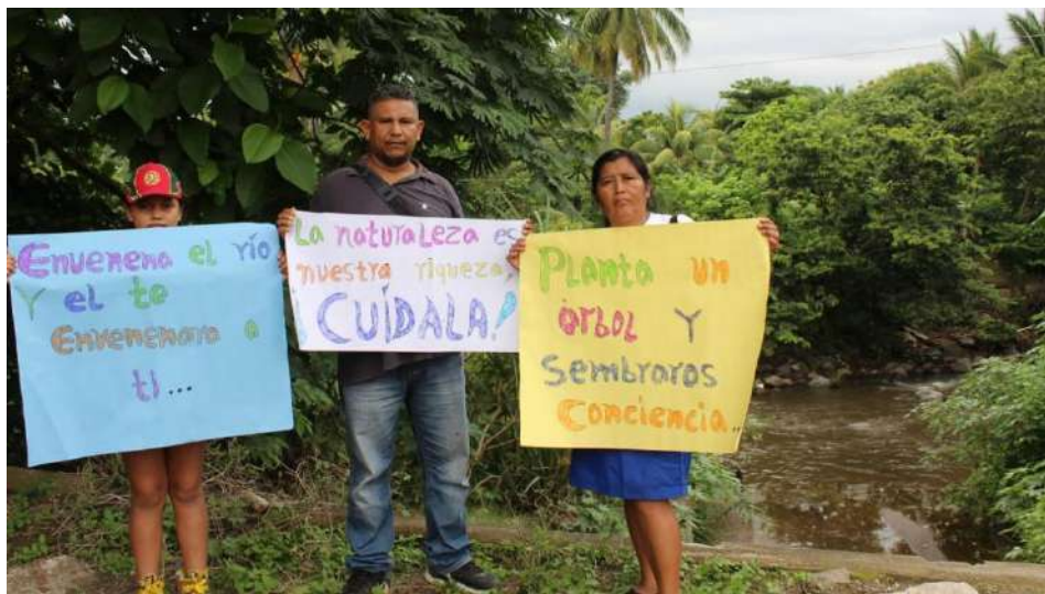
Comunidades del departamento de Sonsonate se manifestaron contra la contaminación del río Ceniza.

Comunidades organizadas junto a Radio Sensunat y la Fundación Maquilishuatl realizaron una caminata en el municipio de Nahulingo en el marco del 5 de junio, Día Mundial del Medio Ambiente, cuyo lema de este año fue: “Contaminación del aire”, como llamado a la acción frente a este problema que afecta a millones en todo el mundo.