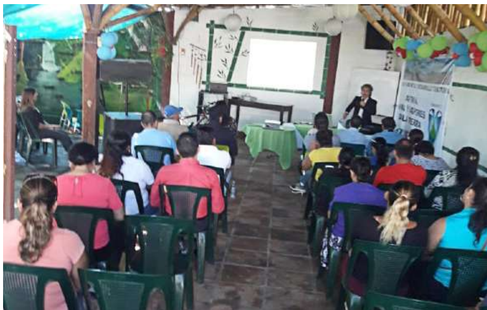
El Foro se llevó a cabo en el municipio de Apopa, departamento de San Salvador.

El pasado 26 de junio se llevó a cabo el Foro Ambiental y Desarrollo Territorial denominado “Salvemos Valle El Ángel: Apopa. Agua y Vapores de la Tierra”, el cual se desarrolló con el objetivo de conocer la situación de la Cuenca del volcán de San Salvador y La Ley de Áreas Naturales Protegidas y Corredor Biológico, como Marco Jurídico de Protección.