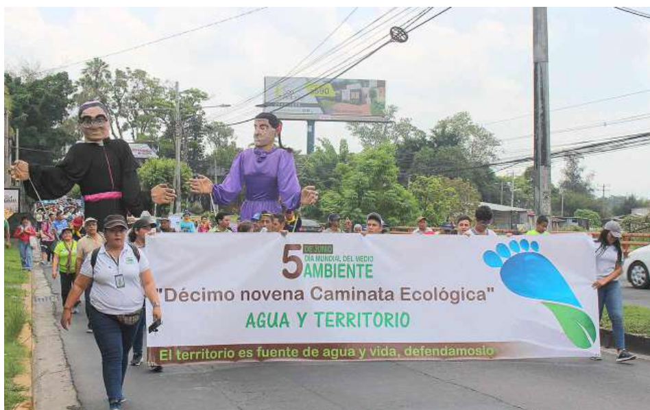
La Caminata Ecológica partió del Parque Cuscatlán, con el objetivo de llegar hacia Casa Presidencial.