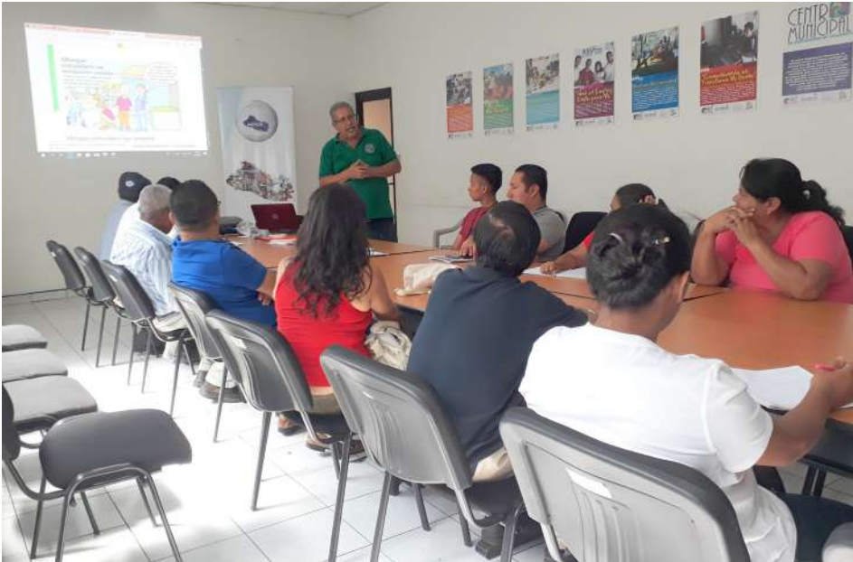
Representantes de CCPC del cantón Montreal del municipio de mejicanos se fortalecen gracias a la MPGR.