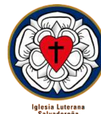
Iglesia Luterana Salvadoreña