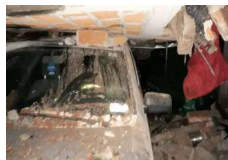
Afectaciones en viviendas del Cantón Santa Lucía, Ciudad Arce.