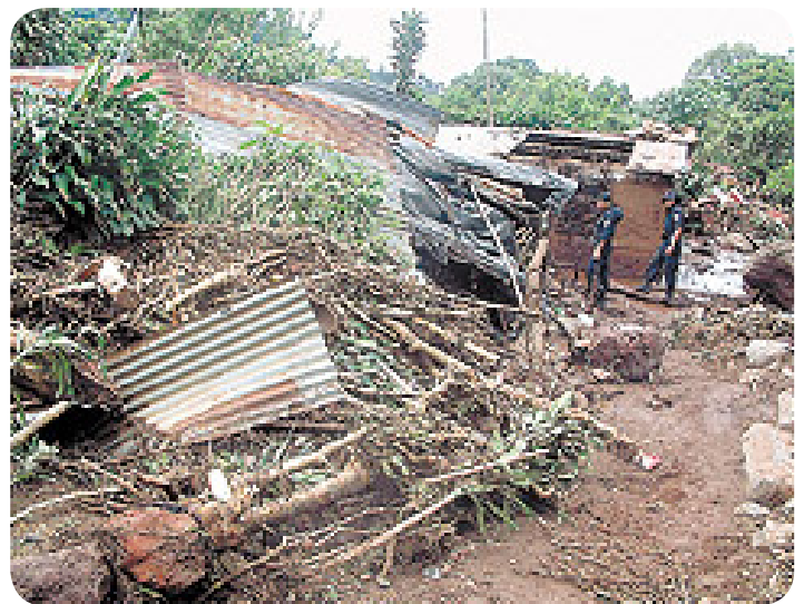
Afectados. Unas 75 viviendas fueron destruidas por los aludes de lodo que cayeron.