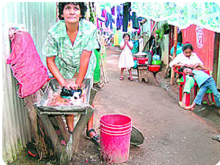
Consecuencias. Las condiciones en que viven ocasionan serios problemas. Los pasajes son estrechos, las casas inseguras y señalan plagas de ratones y otros transmisores de enfermedades.